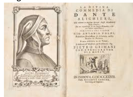
Illustrazione dantesca- Divina commedia

Questa giornata ci ha insegnato che si può imparare divertendosi. Mettersi in gioco, collaborare con i compagni e ridere insieme rende lo studio meno pesante e molto più efficace. Lezioni come questa, vissute all'aria aperta e basate sul gioco di squadra , sono il modo migliore per rendere la cultura un patrimonio di tutti. Speriamo sia solo la prima di una lunga serie!